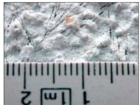
3.2.8 Variable Ursache:

Risse in der Putzoberfläche durch Frost; der Deckputz ist in seinen Eigenschaften gestört, das Bewuchs-Risiko hoch.